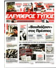
Λίγο πριν τα μεσάνυχτα της «μαύρης» Δευτέρας και μετά την ενημέρωση του πρωθυπουργού από την ηγεσία της Πυροσβεστικής, δεν έγινε λόγος για νεκρούς