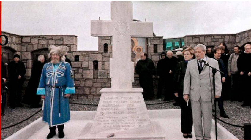
Ο Ποπόφ υπήρξε ένας αξιόλογος και άκρως δραστήριος Ρώσος αξιωματούχος σε ολόκληρη την περιοχή της Βόρειας Ελλάδας και όχι μόνο, αφού το 2003 μαζί με τον φίλο του και τότε σταθμάρχη της SVR στην Αθήνα, Λεονίντ Ρεσέτνικοφ, ανέλαβαν την πρωτοβουλία και πραγματοποίησαν τις πρώτες ενέργειες για τη δημιουργία του ρωσικού νεκροταφείου στη Λήμνο, που εντασσόταν στις προσωπικές προτεραιότητες του Βλαντιμίρ Πούτιν στην Ελλάδα!

Η συγκεκριμένη πιθανότητα ενισχύεται και από τη μάλλον πρόσφατη και κάτω από αδιευκρίνιστες και αινιγματικές συνθήκες και σκοπιμότητες κλειστού χαρακτήρα άτυπη ενημέρωση επιλεγμένων αλλά άγνωστου αριθμού δημοσιογράφων, εκ μέρους του διοικητή της ΕΥΠ Γιάννη Ρουμπιάτη, ο οποίος αναφέρθηκε αόριστα σε ένα εν εξελίξει σχέδιο υπονόμησης και αποσταθεροποίησης της ΕΥΠ από κάποια ομάδα προσώπων που έχουν ή είχαν σχέση με την ελληνική μυστική υπηρεσία. Ο ίδιος τόνισε ότι υπάρχουν σαφείς υπόνοιες πως τα πρόσωπα αυτά ενεργούν για λογαριασμό μυστικών υπηρεσιών «μη δυτικής χώρας και βορειοανατολικής κατεύθυνσης», φωτογραφίζοντας ουσιαστικά τη Ρωσία, ενώ συγχρόνως -και μάλλον ανεπιτυχώς- προσπάθησε να χαρακτηρίσει αναξίπιστο τον βασικό πληροφοριοδότη του «Σχεδίου Πυθία