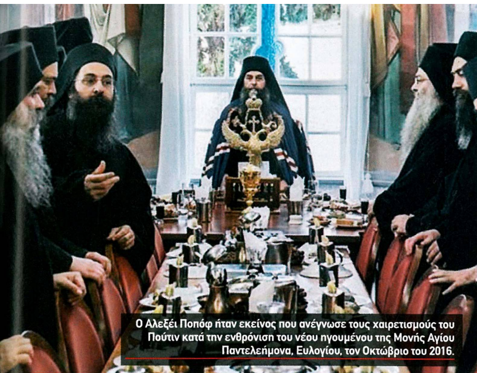
Ο Αλεξέι Ποπόφ ήταν εκείνος που ανέγνωσε τους χαιρετισμούς του Πούτιν κατά την ενθρόνιση του νέου ηγουμένου της Μονής Αγίου Παντελεήμονα, Ευλογίου, τον Οκτώβριο του 2016.

στην Αθήνα, Λεονίντ Ρεσέντικοφ, ανέλαβαν την πρωτοβουλία και πραγματοποίησαν τις πρώτες ενέργειες για τη δημιουργία του ρωσικού νεκροταφείου στη Λήμνο, που εντασσόταν στις προσωπικές προτεραιότητες του Βλαντιμίρ Πούτιν στην Ελλάδα.