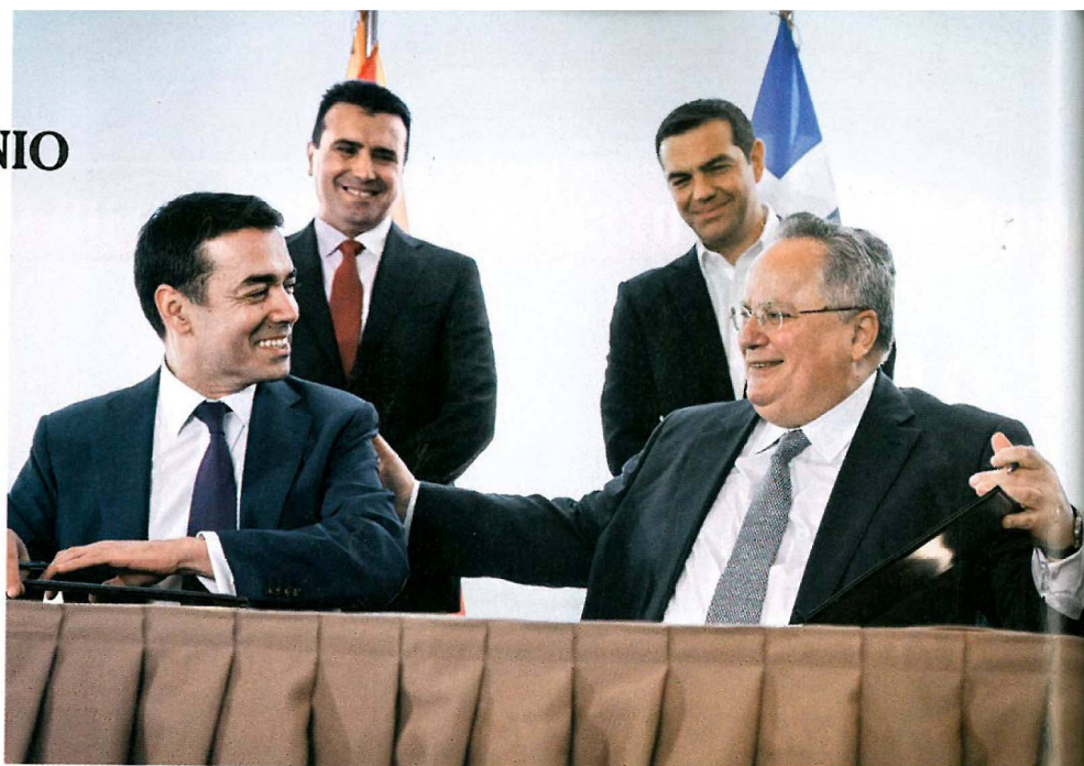
Η στιγμή που στη λίμνη των Πρεσπών υπογράφεται η συμφωνία μεταξύ Ντιμιτρόφ - Κοτζιά υπό το βλέμμα Τσίπρα - Ζάεφ...

Ποτέ όμως δεν χρησιμοποιήθηκαν τέτοιου είδους μεθοδεύσεις και επίσημες ανακοινώσεις για τις απε-