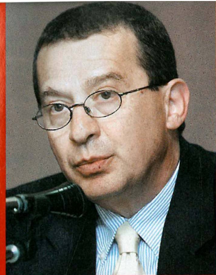
ΑΡΙΣΤΕΡΑ: Ο πρέσβης Ανδρέας Φρυγανιάς. ΔΕΞΙΑ: Ο Γιάννης Ρουμπάκης.

και επιδίωξη ματαίωσης της Συμφωνίας των Πρεσπών, θα έπρεπε να αποκαλυφθούν οι συγκεκριμένες κεκαλυμμένες και μέσω των «παράνομων» δικτύων ρωσικές δραστηριοποιήσεις. Αντίθετα, η ελληνική κυβέρνηση υπέπεσε σε διπλό λάθος, αφού κατηγόρησε ευθέως τη Μόσχα για επηρεασμό επιχειρηματιών, προσέγγιση κρατικών λειτουργών και διοργάνωση συλλαλητηρίων, μέσω μελών της επίσημης ρωσικής εκπροσώπησης, που απέβλεπαν στη ματαίωση της συγκεκριμένης συμφωνίας, χωρίς να αναφέρει και να προβάλλει κανένα σχετικό στοιχείο, ενώ συγχρόνως ουδεμία αναφορά έκανε για δράσεις μυστικών ρωσικών κλιμακίων και δικτύων, ισχυρισμοί που, έστω και χωρίς στοιχεία, θα μπορούσαν να θεωρηθούν αληθοφανείς, αφού αυτές οι μέθοδοι δράσης ακολουθούνται από τις ρωσικές μυστικές υπηρεσίες σε παρόμοιες περιπτώσεις. Το μεγάλο λάθος ίσως να οφείλεται και σε σχετική εισήγηση ή άποψη της ΕΥΠ, η οποία σε μια τέτοια περίπτωση εντοπίζεται να αγνοεί τις μεθόδους δράσης των ρωσικών υπηρεσιών πληροφοριών στο ελληνικό έδαφος και να αδυνατεί να συλλέξει και να προβάλει συγκεκριμένες δράσεις, συγκεκριμένων ατόμων, σε συγκεκριμένους χρόνους και με συγκεκριμένο σκοπό, συγχέοντας ενδεχομένως τις μεθόδους δράσης των ρωσικών μυστικών υπηρεσιών με εκείνες των αντίστοιχων αμερικανικών, οι οποίες ενεργούν ακριβώς όπως καταγγέλλονται, στη συγκεκριμένη περίπτωση, οι Ρώσοι.